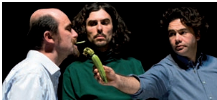
Cie I Sacchi di Sabbia